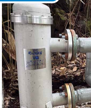
業務用 FFC元始活水器 V65型