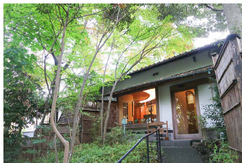
伊豆高原 城ヶ崎温泉 花吹雪 静岡県伊東市八幡野1041 TEL:0557-54-1550