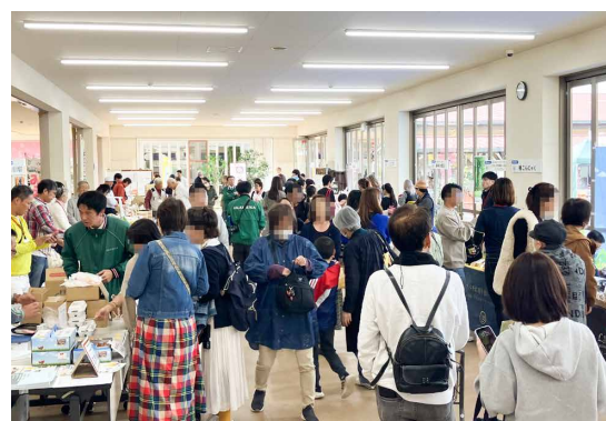
リピーターのお客様も多く、イベントが定着してきています。

年々リピーターの方が増え、FFCの魅力が確実に広がっていることを実感しております。今後も、より多くのお客様にFFCテクノロジーの価値と、FFCを活用して生まれる商品の素晴らしさをお伝えしてまいりたいと考えております。