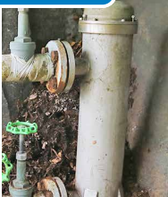
業務用 FFC元始活水器 V40型