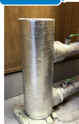
業務用 FFC元始活水器 V40型