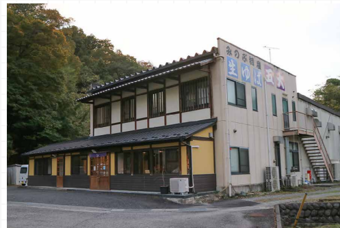
ゆば工房五大 山梨県南巨摩郡身延町帯金 3705-1 TEL:0556-62-3535