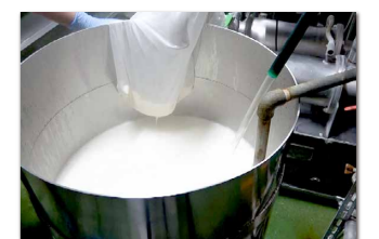
出来上がった豆乳に水を追加している様子