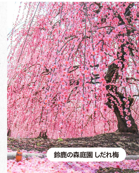
鈴鹿の森庭園 しだれ梅