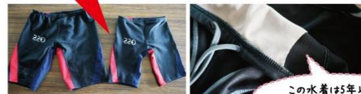
左：1年以上使用 右：新品

通常は、1年も経つと水着の色が落ち、生地ももろくなってしましますが、FFCのプールに入っていると1年経っても色落ちがほとんどありません！生地も劣化しないので、1年以上使うことができています！